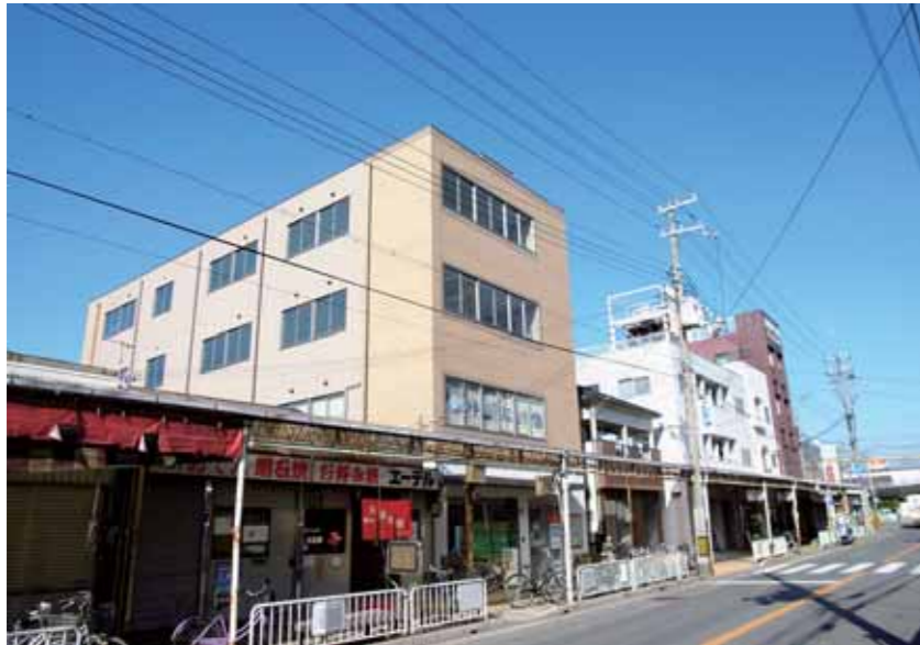
東側道路より当ビル、山陽「西新町駅」方向を見る