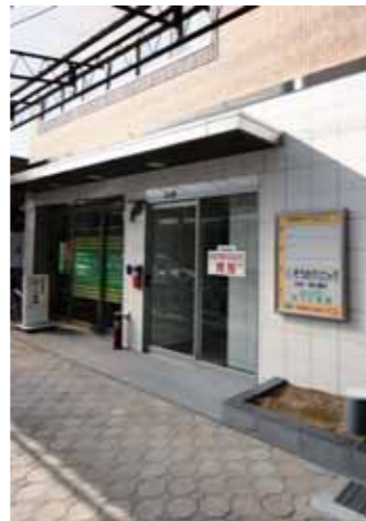
1Fエントランスホールを見る