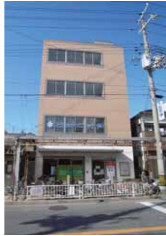
東側道路より建物正面を見る