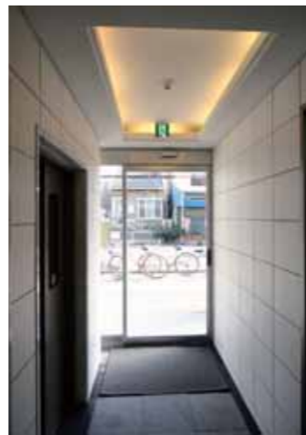
1Fエントランスホールより外部を見る