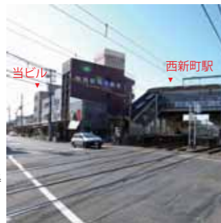
山陽「西新町駅」より当ビルを見る