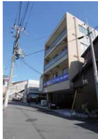
西側道路より見る、1F部分は駐車場